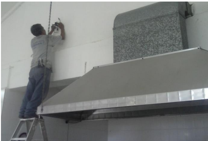
REUBICACION DE CAMARA DE VIGILANCIA (DURANTE MSU DESMONTAJE)