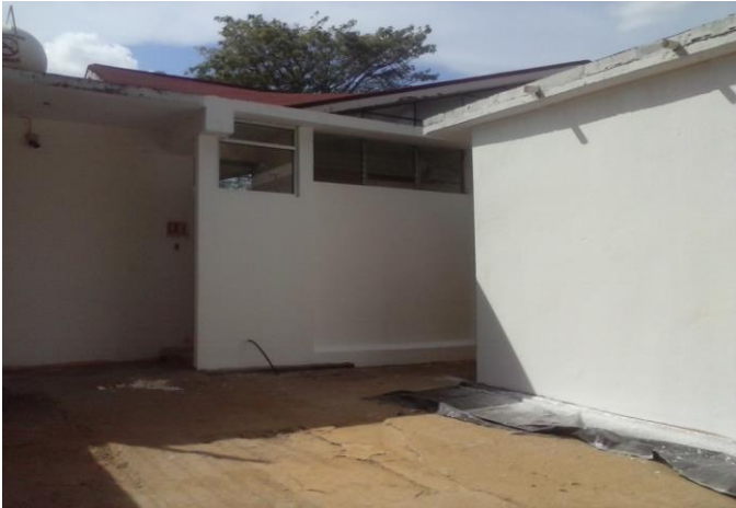
APLICACIÓN DE PINTURA VINILICA EN EXTERIORES (AREA DE SERVICIO ACCESO POSTERIOR DE COCINA Y CENTRO DE COMPUTO)

CENTRO CENDI MARINA CORTAZAR ASISTENCIAL: _____ PERÍODO : SEMANA 1 DEL VIERNES-07-AGOSTO-2015 AL DOMINGO 09-AGOSTO-2015