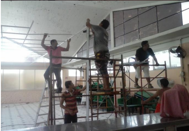
FABRICACION DE PLAFON DE TABLAROCA EN: AREA DE COCINA-COMEDOR EN PROCESO