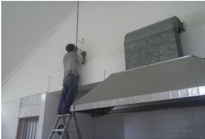
REUBICACION DE CAMARA DE VIGILANCIA (EN SU UBICACIÓN INICIAL)

CENTRO: CENDI "MARINA CORTAZAR" ASISTENCIAL: _____ PERÍODO: SEMANA 1 DEL VIERNES-07-AGOSTO-2015 AL DOMINGO 09-AGOSTO-2015