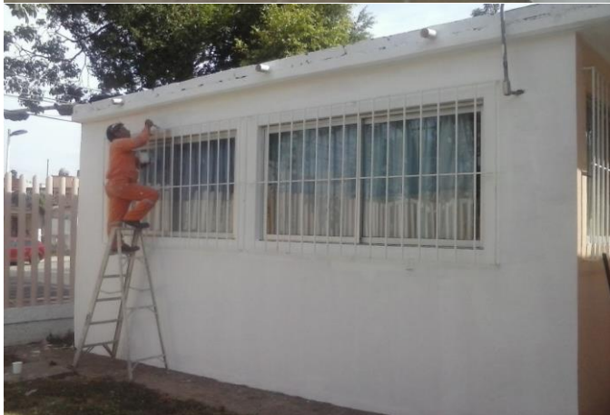
APLICACIÓN DE PINTURA VINILICA EN EXTERIORES (AREA DE CENTRO DE COMPUTO)