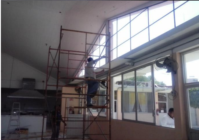
FABRICACION DE PLAFON DE TABLAROCA EN: AREA DE COCINA-COMEDOR INICIO