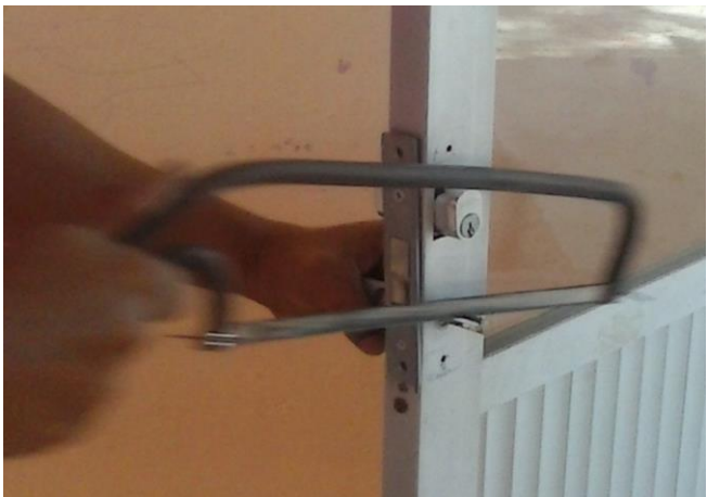
CAMBIO DE CERRADURAS EN PUERTA DE ALUMINIO DIVERSAS AREAS EN PROCESO