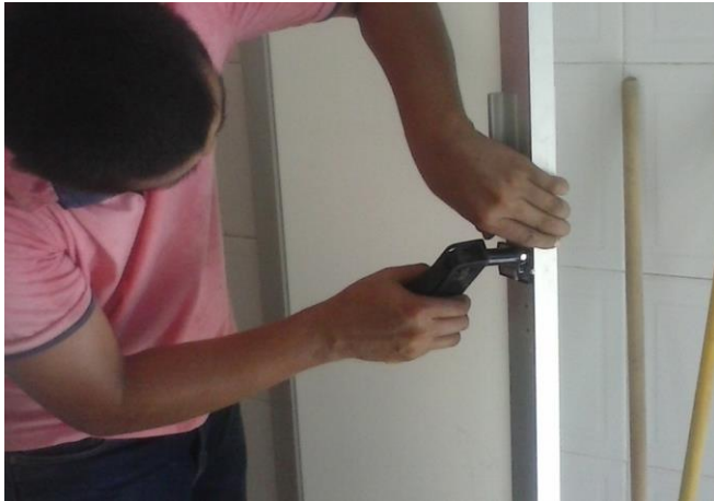
CAMBIO DE CERRADURAS EN PUERTA DE ALUMINIO DIVERSAS AREAS DESMANTELANDO