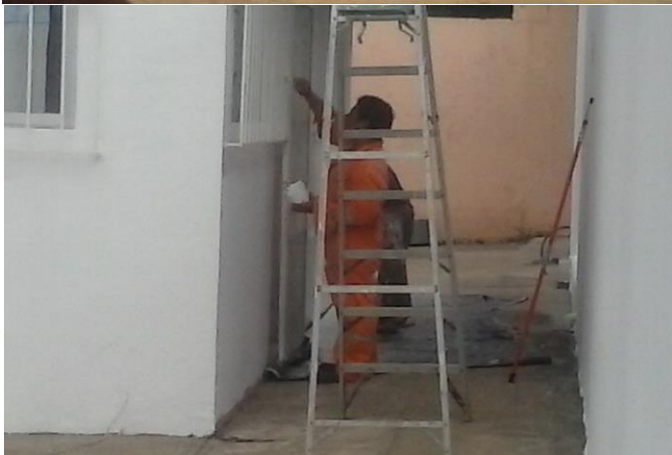
APLICACIÓN DE PINTURA VINILICA EN EXTERIORES (AREA DE SERVICIO ACCESO POSTERIOR DE COCINA Y CENTRO DE COMPUTO)