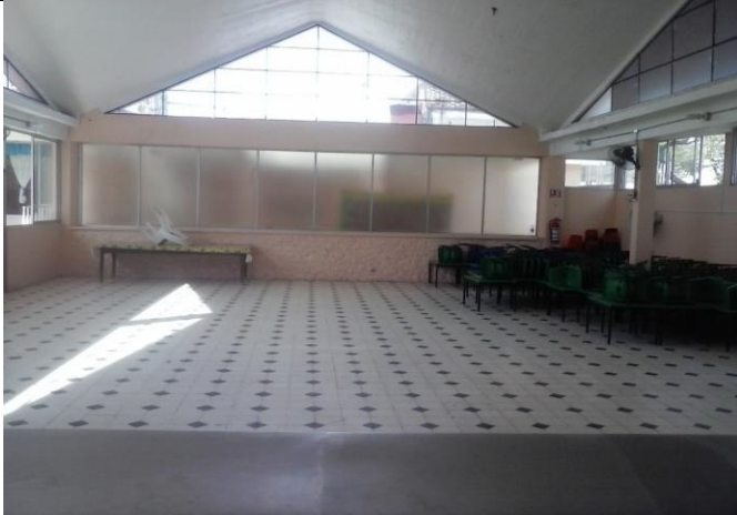
FABRICACION DE PLAFON DE TABLAROCA EN: AREA DE COCINA-COMEDOR AREA LIBRE

CENTRO CENDI "MARINA CORTAZAR" ASISTENCIAL: PERÍODO : SEMANA 1 DEL VIERNES-07-AGOSTO-2015 AL DOMINGO 09-AGOSTO-2015